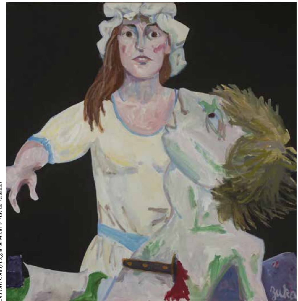
Charlotte Corday poignarde Marat © Ville de Versailles

Zuka Charlotte Corday poignarde Marat Collection de l'artiste © Ville de Versailles