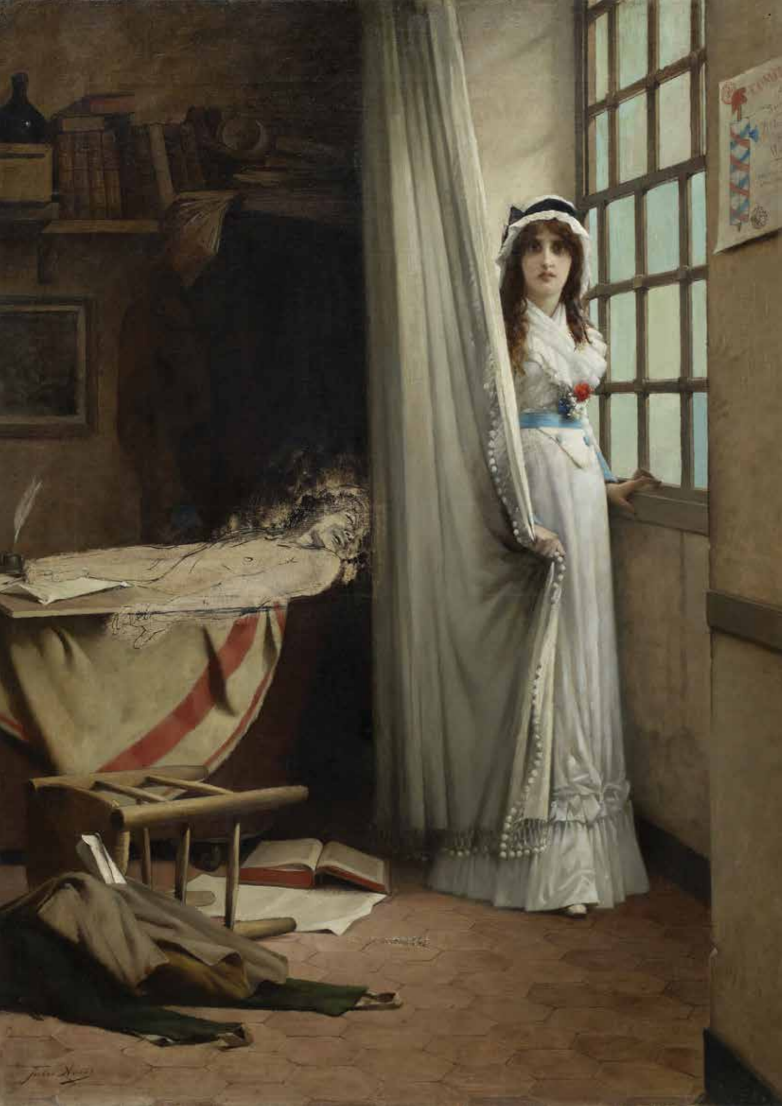
Étude préparatoire pour Charlotte Corday et Marat