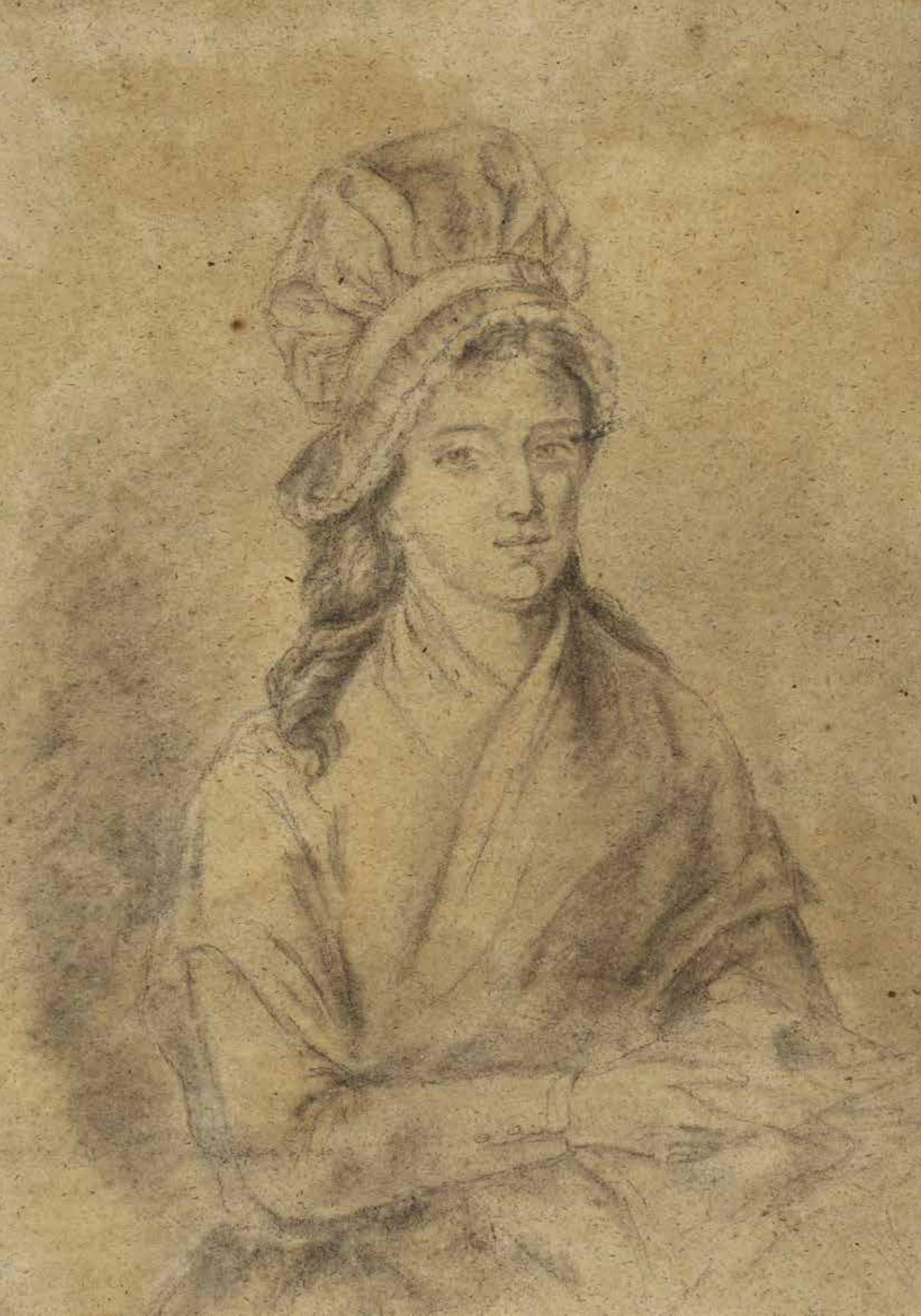
Charlotte Corday assise tenant un livre